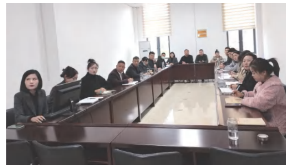
中泰地产公司强化全员抖音短视频培训