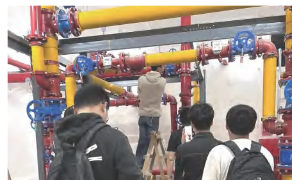
4月28日中信仁和制造基地消防验收