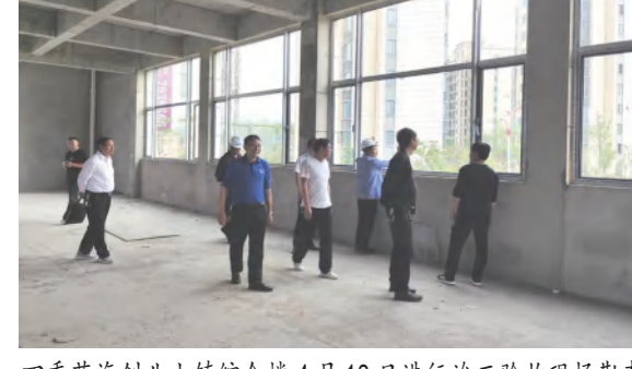
四季花海创业小镇综合楼4月18日进行竣工验收现场勘察