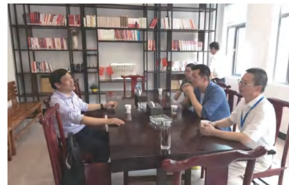
《中华文化报》实地采访四季花海