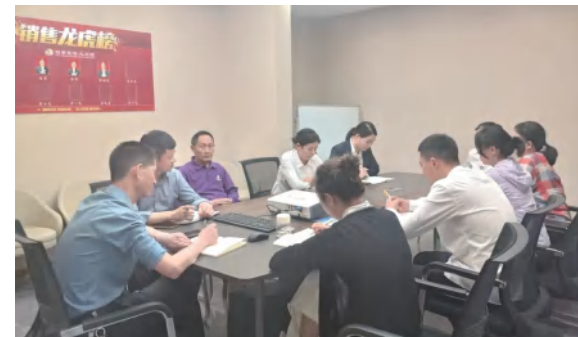
四季花海置业公司加强4月外拓客户工作分析总结