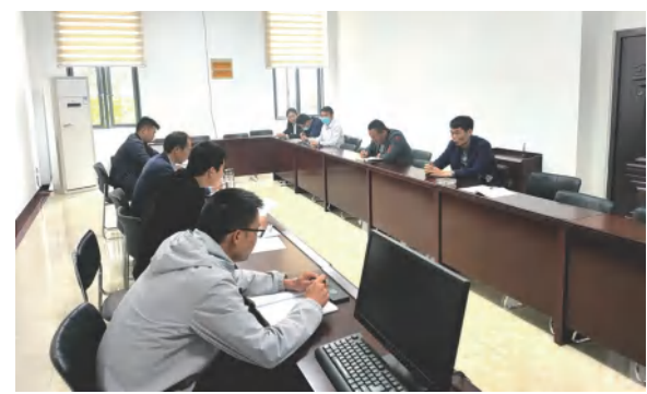
顺民置业公司组织召开中泰大公馆项目一期物业承接查验前问题处理协调会