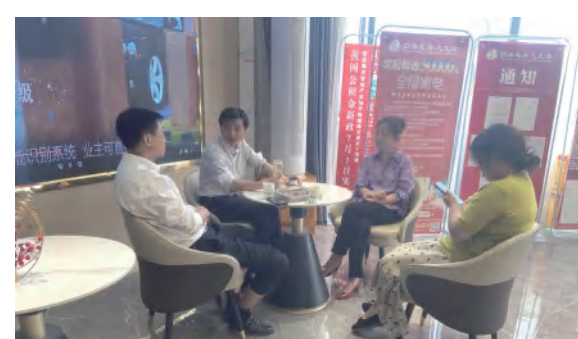
四季花海置业公司与公积金管理部门加强贷款政策对接