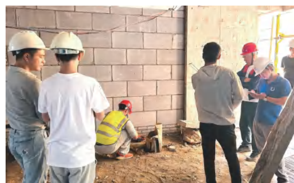
湖北金港汽车公园项目14#、15#楼回填土质量环刀法检测