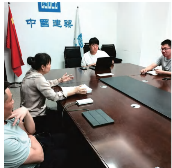
建筑事业部加强创意楼结算问题协商研究