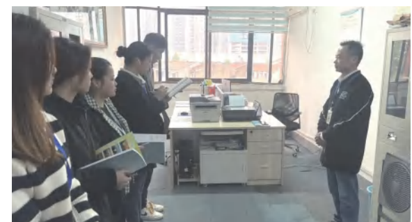
集团办公室与建筑事业部办公室完成业务归并整合