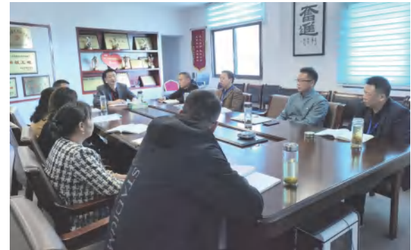
建筑事业部召开专题会研究KPI考核改进工作