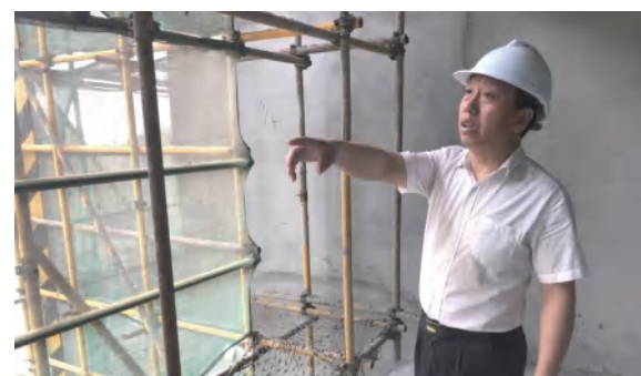
建筑事业部生产保障部对中泰大公馆项目进行现场安全检查