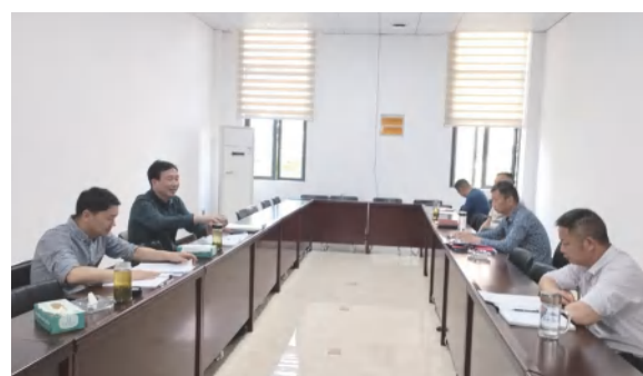
中泰地产公司4月17日召开执行董事会一季度例会