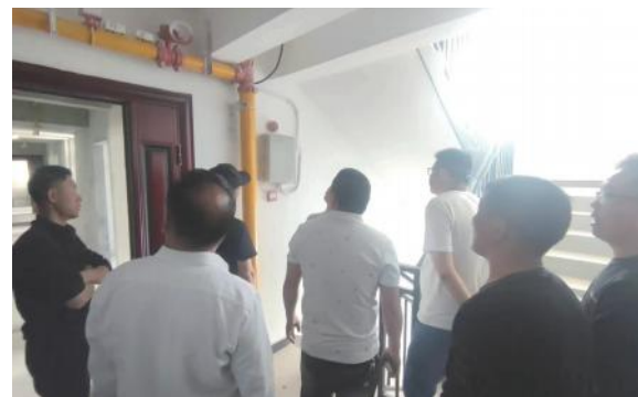
中信仁和制造基地项目4月15日组织土建及安装分项内部验收